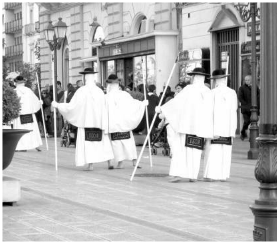
I riti della Settimana Santa a Taranto